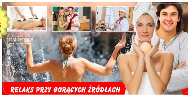
RELAKS PRZY GORĄCYCH ŹRÓDLACH

Eger to malownicza miejscowość turystyczna, położona u stóp Gór Bukowych, słynąca z zabytków, barwnej historii oraz źródeł wód termalnych i dobrego wina w dolinie „Pięknej Pani”. Pobyt w stolicy północnych Węgier to gwarancja wspaniałego mikroklimatu, pięknej i słonecznej pogody, wypoczynek przy basenach termalnych oraz wiele ciekawostek do odkrycia!