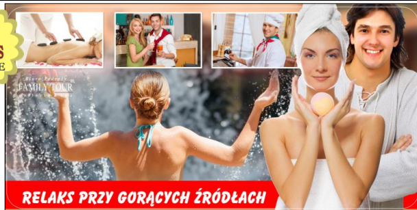
RELAKS PRZY GORĄCYCH ŹRÓDLACH

Eger - piękna stolica północnych Węgier, położona u stóp Gór Bukowych, słynąca z zabytków, barwnej historii oraz gorących źródeł wód termalnych i pysznego wina doliny „Pięknej Pani”. Piękna słoneczna pogoda, ciepły mikroklimat, wiele zabytków i ciekawostek na wyciągnięcie ręki a do tego nieograniczone korzystanie z basenów termalnych wód gwarantują iż wypoczynek będzie cudowny!