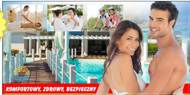
KOMFORTOWY, ZDROWY, BEZPIECZNY

oraz napoje – GRATIS All Inclusive (bez ograniczeń!!)