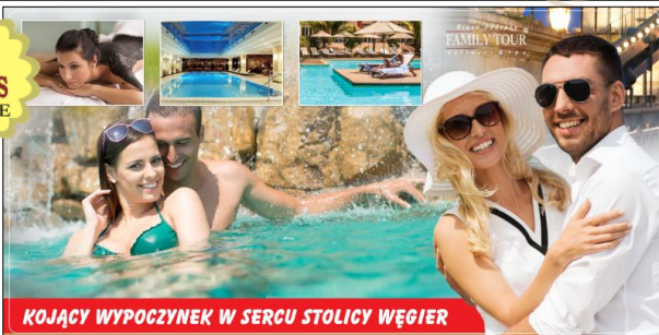
KOJĄCY WYPOCZYNEK W SERCU STOLICY WĘGIER

Budapeszt , należy do najpiękniejszych stolic Europy, mało jednak kto wie, iż w samym sercu miasta na środku Dunaju jest wyspa nazywana wyspą św. Małgorzaty (Margitsziget). Znajduje się tutaj renomowane uzdrowisko szczyjące się wielowiekową tradycją wykorzystania wód termalnych i borowin oraz kąpeli z korzyścią dla zdrowia. Spędzimy wSPAniały urlop z korzyścią dla zdrowia w malowniczej aurze!